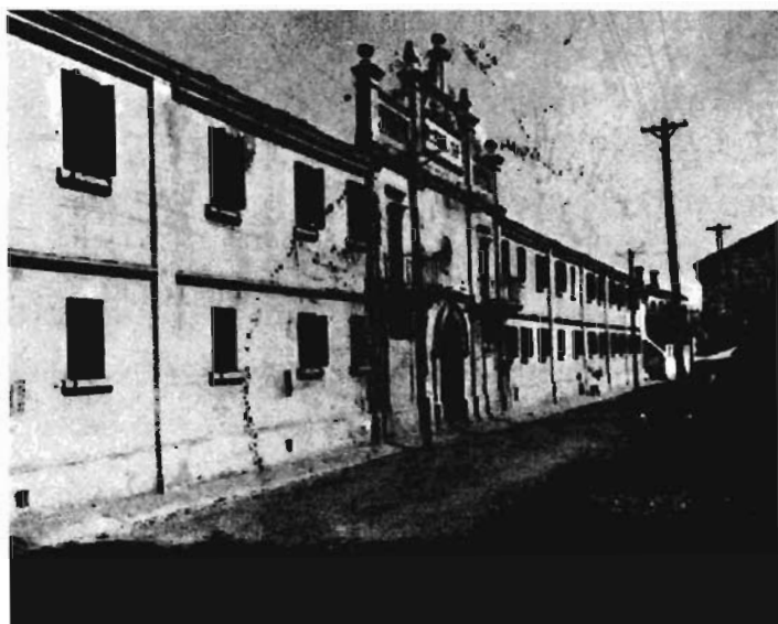
五大开幕地点——武昌高等师范第一附属小学

1927年4月27日至5月9日，中国共产党第五次全国代表大会在武昌高师第一附小的小礼堂隆重开幕（之后在汉口黄陂会馆继续举行）。出席会议的代表共82人，代表党员57967人，以罗易、多里奥、维经斯基组成的共产国