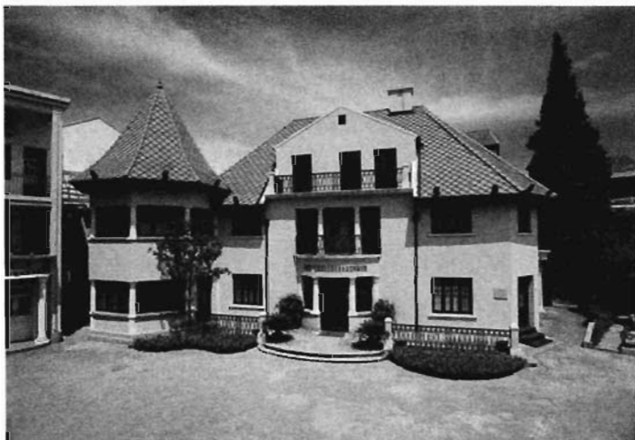
四大史料陈列馆外景

1925年1月11日至22日，中国共产党第四次全国代表大会在上海召开。出席大会的代表20人，代表党员994人。共产国际代表维经斯基参加了大会。这次大会初步总结了建党以来的经验教训，特别是国共合作一年来的经验教训，从理论上把有关中国民主革命的基本问题加以系统化，解决了党加入和领导中国革命的方式和路径的问题，树立了将