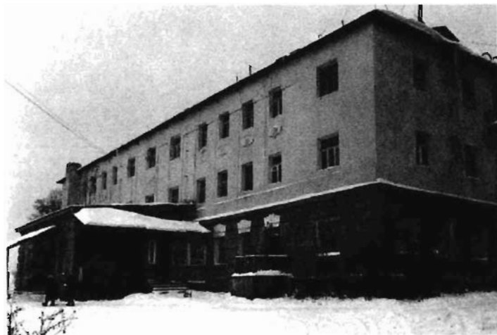
莫斯科近郊中共六大会址

1928年6月18日至7月11日，在共产国际的帮助下，中国共产党第六次全国代表大会在苏联首都莫斯科召开。出席大会的共有142人，其中有选举权的正式代表84人。大会指出：中国社会的性质仍然是半殖民地半封建社会；现阶段中国革命的性质是资产阶级民主革命；目前的政治形势正处于两个革命高潮之间；党的总任务不是进攻，而是争取群