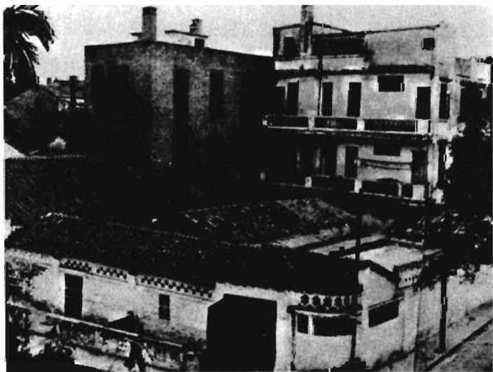
三大会址：广州东山恤孤院路后街 31 号

1923 年 6 月 12 日至 20 日，中国共产党第三次全国代表大会在广州举行。出席大会的代表 30 余人，代表全国 420 名党员。共产国际代表马林参加会议。大会的中心议题是国共合作问题。大会正式决定和国民党合作——共产党员以个人名义加入国民党，建立民主革命的统一战线，