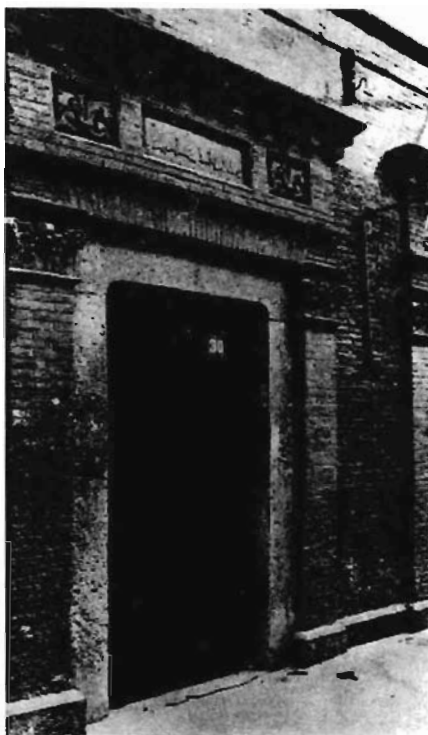
二大旧址：上海南成都路辅德里 625号（今成都北路7弄30号）

1922年7月16日至23日，中国共产党第二次全国代表大会在上海举行。12名代表出席会议，代表全国195名党员。大会制定了党的最高纲领和最低纲领，第一次明确地提出了反帝反封建的民主革命纲领，并且指出要通过民主革命为实现社会主义和共产主义创造条件，这是党对中国革命认识的一个新的重大突破。大会通过了《中国共产党章程》、