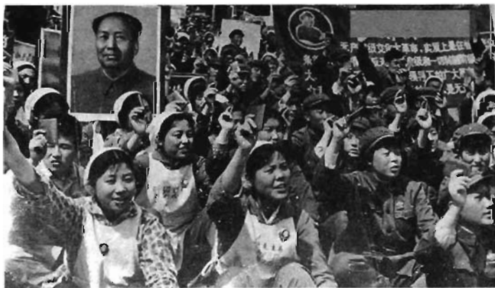
十一大之后，文革结束

1977年8月12日至18日，中国共产党第十一次全国代表大会在北京举行。出席代表1510人，代表全国3500多万党员。华国锋主持大会并代表中共中央作政治报告，叶剑英作《关于修改党的章程的报告》，邓小平致闭幕词。大会通过了政治报告、修改党章的报告和《中国共产党章程》。大会宣告了“文化大革命”的结束，在揭批江青反革命集团和动员全党建设社会主义现代化强国方面起了积极作用。但是，这次大会的政治报告仍然肯定“文化大革命”